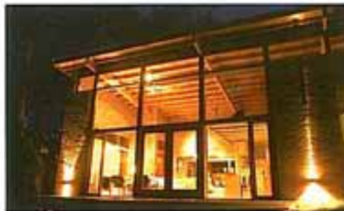
FACHADA. LADRILLO COMUN RASADO, VIDRIO Y MADERA.