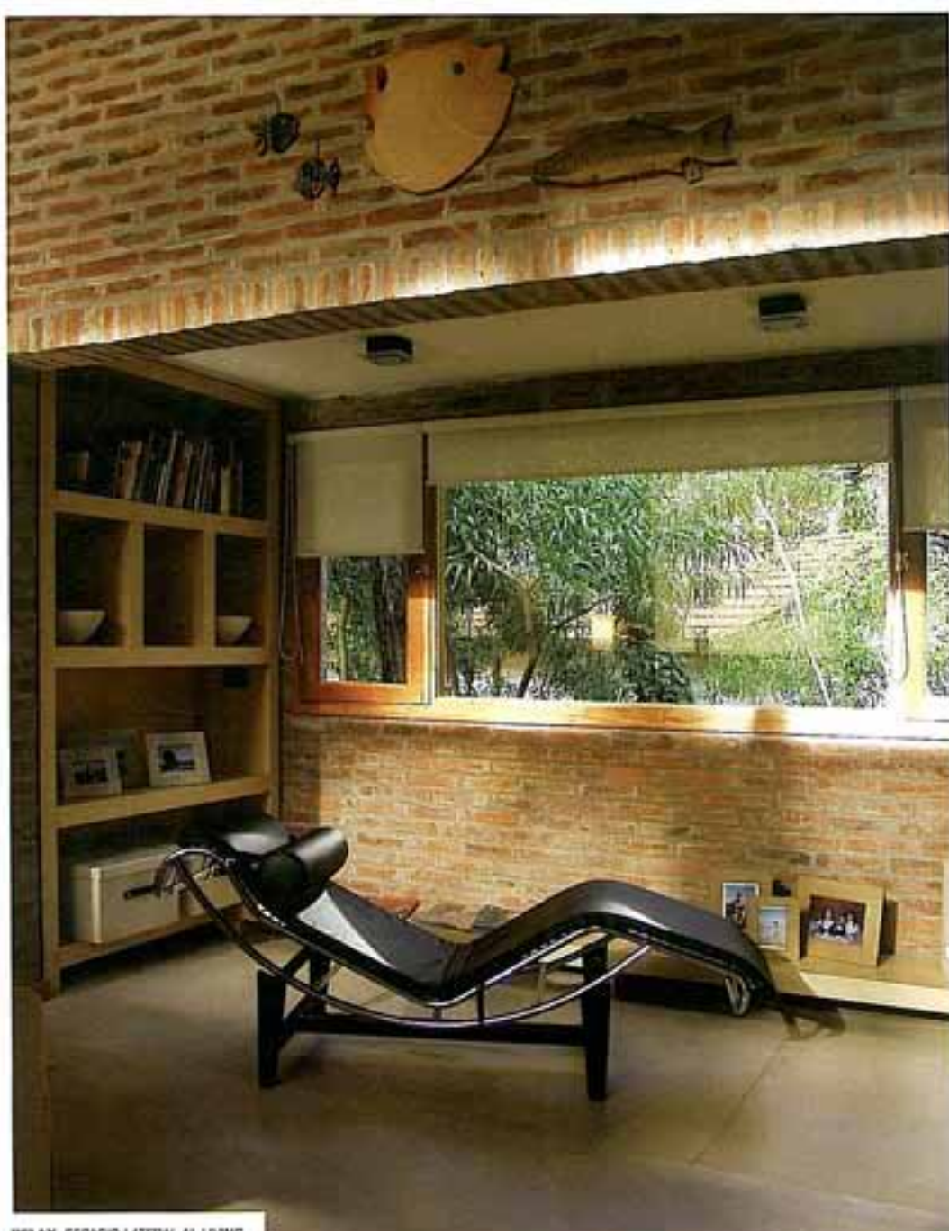
RELAX. ESPACIO LATERAL AL LIVING.

Según sus autoras, la casa Shaw Golf es un ejemplo de los nuevos rumbos que existen en la actualidad arquitectónica de Pinamar. Rumbos que según ellas, "reconocen que construir en la ciudad balnearia tiene el privilegio del paisaje como elemento preponderante de diseño".